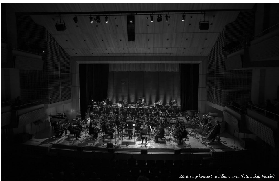
Závěrečný koncert ve Filharmonii