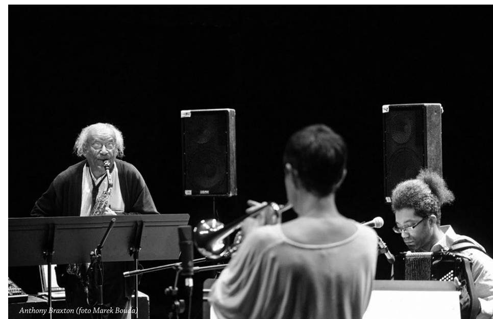
Anthony Braxton