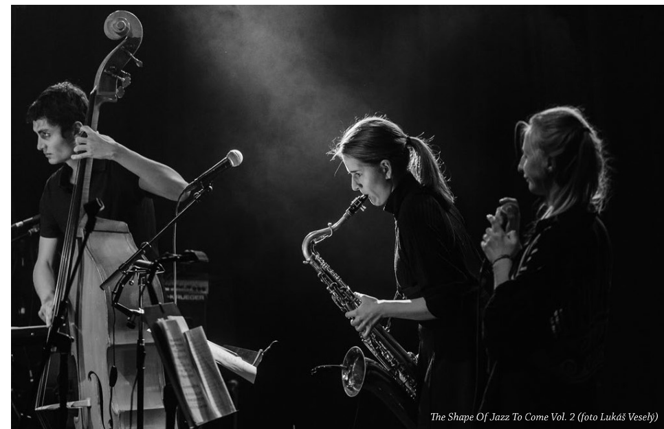
The Shape Of Jazz To Come Vol. 2

Ve čtvrté večer se program přesunul do Biva Central, tentokrát pod názvem Velké cíle – Kolik máme možností . O naprostou senzaci se postarala francouzsko-italská úderka Abacaxi pod vedením kytaristy Juliana Despreze, kterému zde skvostně vteč než sekundovali basista a elektronik Jean-Francois Riffaud a bubeník Francesco Pastacaldi. Tohle je rozhodně více než hlukařina (kteréžto označení jsem vyslechl následně v předání). Jasně, ony se tam vlastně vyskytují určité zvukové stěny, ale vše je to dokonale zkonstruované, promyšlené včetně světelného designu. To ovšem